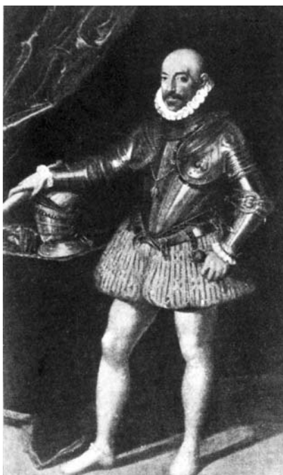
Retrato de Marc'Antonio Colonna.

En 1549 el mismo Paolo III, antes de morir, entrega Monte Compatri, Marino, Rocca de Papa, Ardea y Nemi a Bernardino, obispo de Sorrento 16 . El 8 de marzo de 1550, Julio III restituye el feudo de Monte Compatri a los Colonna, pero su sucesor, Paolo IV, Carafa, en 1556 lo priva todavía y él lo asigna a su nieto Carlo 17 . En 1559, Pío IV, Carafa, lo devolvió a Marco Antonio II 18 . Él era hijo de Ascanio y su heredero por la inmadura muerte del hermano primogénito. Él fue el capitán de la