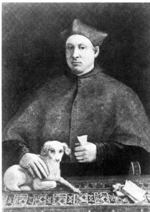
El Cardenal Pompeo Colonna (retrato de Lorenzo Loto) – Roma Galería Colonna.

Currió la voz que estuviese muriendo. Pompeo, cubrió el traje violáceo con la armadura, se precipitó en Roma y reunió a los Conti, a los Orsini, a los Savelli, a los Anguillara, a los Cesarini y a los suyos de casa Colonna, les indujo a que terminaran sus disputas para conquistar juntos el poder ciudadano y a proclamar la independencia de Roma del Papado.