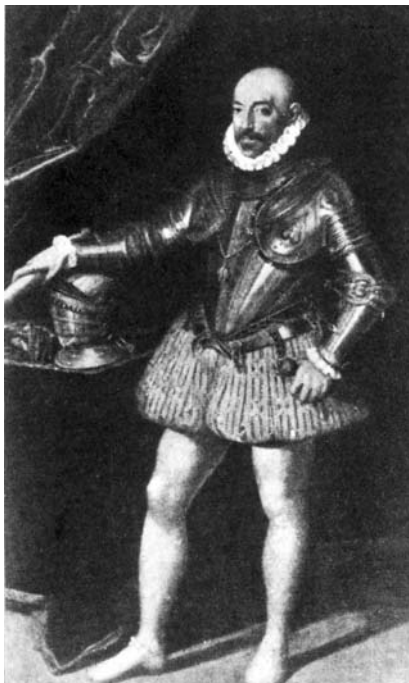
Retrato de Marc'Antonio Colonna.

En 1549 el mismo Paolo III, antes de morir, entrega Monte Compatri, Marino, Rocca de Papa, Ardea y Nemi a Bernardino, obispo de Sorrento 16 . El 8 de marzo de 1550, Julio III restituye el feudo de Monte Compatri a los Colonna, pero su sucesor, Paolo IV, Carafa, en 1556 lo priva todavía y él lo asigna a su nieto Carlo 17 . En 1559, Pío IV, Carafa, lo devolvió a Marco Antonio II 18 . Él era hijo de Ascanio y su heredero por la inmadura muerte del hermano primogénito. Él fue el capitán de la