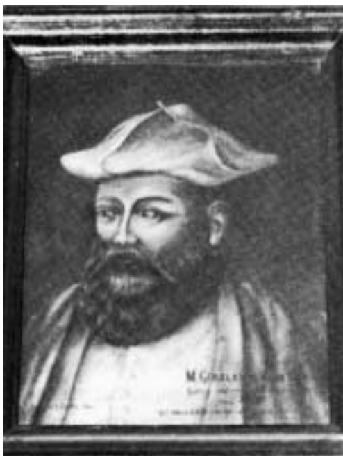
Gerolamo Vida, (quadro conservato nel Convento di S. Silvestro).

Nel 1521 era abate di quell'Abbazia, Gerolamo Vida. Nato a Cremona nel 1490, visse a Roma sotto Giulio II e Leone X. Dotto letterato, umanista e poeta, aveva scritto «De arte poetica», il «Bombice» e la «Scaccheide». Quest'ultima opera aveva suscitato l'ammirazione di Leone X che era un formidabile giocatore di scacchi. Era un abile imitatore dei classici latini e soleva ornare la sua poesia, come si usava a quei tempi, con reminiscenze pagane. Il papa l'indusse a trattare argomenti religiosi e per favorirne l'ispirazione, lo nominò abate di S. Silvestro. Qui, in serenità di spirito e nella pace della natura, scrisse la «Cristiade», poema epico-religioso ispirato al mistero della redenzione umana. Opera allora