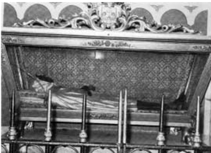
Urna del venerabile Giovanni di Gesù e Maria, generale dell'Ordine e Priore del Convento dei Carmelitani di San Silvestro, morto nel 1615 in odore di Santità.