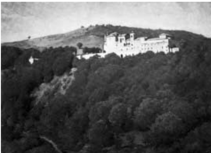
Convento di S. Silvestro, affidato ai carmelitani scalzi fin dal 1604. (Quadro di A. Missori).