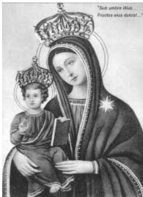
L'immagine della Madonna del Castagno.

loro devozione, ammettendoli nella sua cappella. Così i suoi successori 13 .