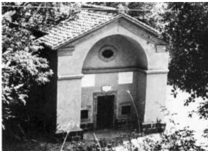
La cappella della Madonna del Castagno.

15 Il trasferimento miracoloso dell'immagine della Madonna, dal convento all'albero di castagno, è una pia leggenda molto diffusa tra la popolazione di Monte Compatri. Le varie fonti storiche (tutte di origine carmelitana) dicono invece che l'immagine fu posta dai frati fuori del convento per compiacere la devozione del popolo.