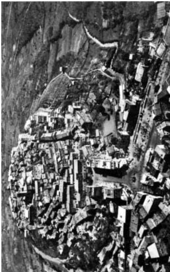
Panorama aereo di Monte Compatri.