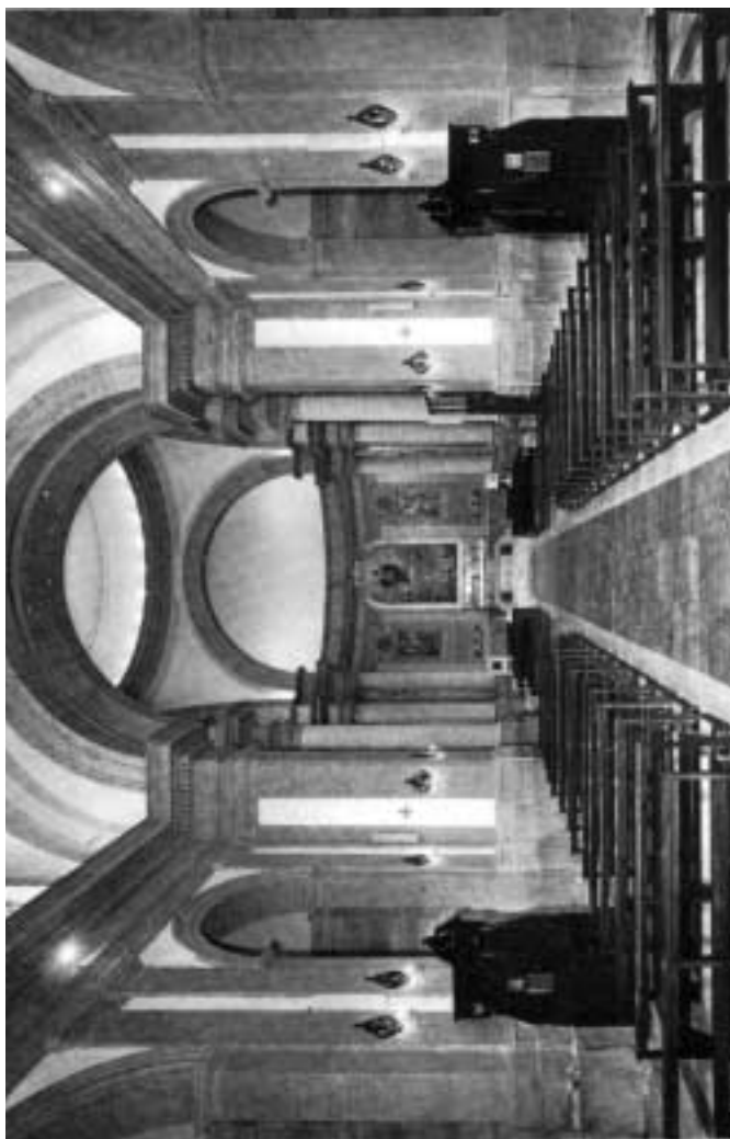
Interno attuale del Duomo di Monte Compatri.