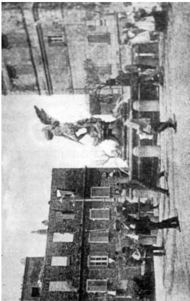
La fontana dell'Angelo.