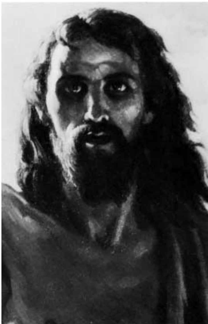
La voce che grida nel deserto - particolare - (opera di A. Missori).