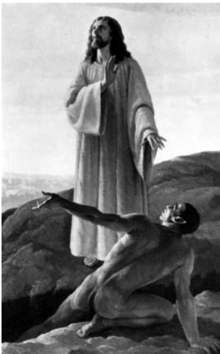
Tentazione sul monte (opera di A. Missori).