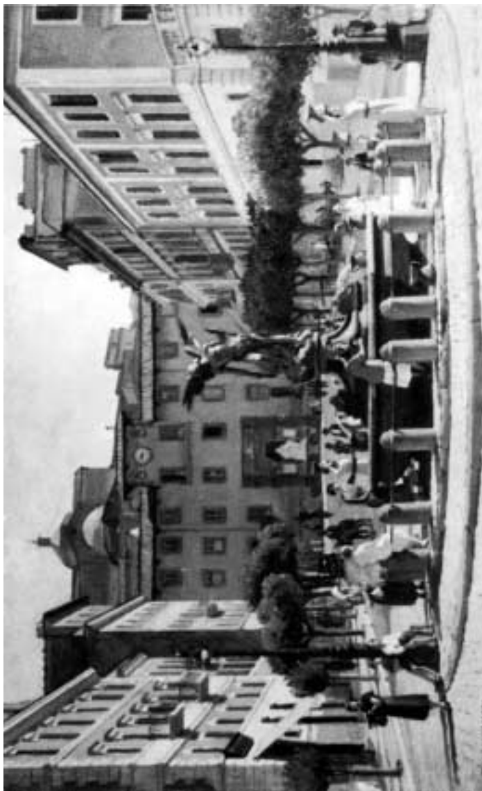
Piazza Marco Mastrofini (da un quadro di A. Missori).