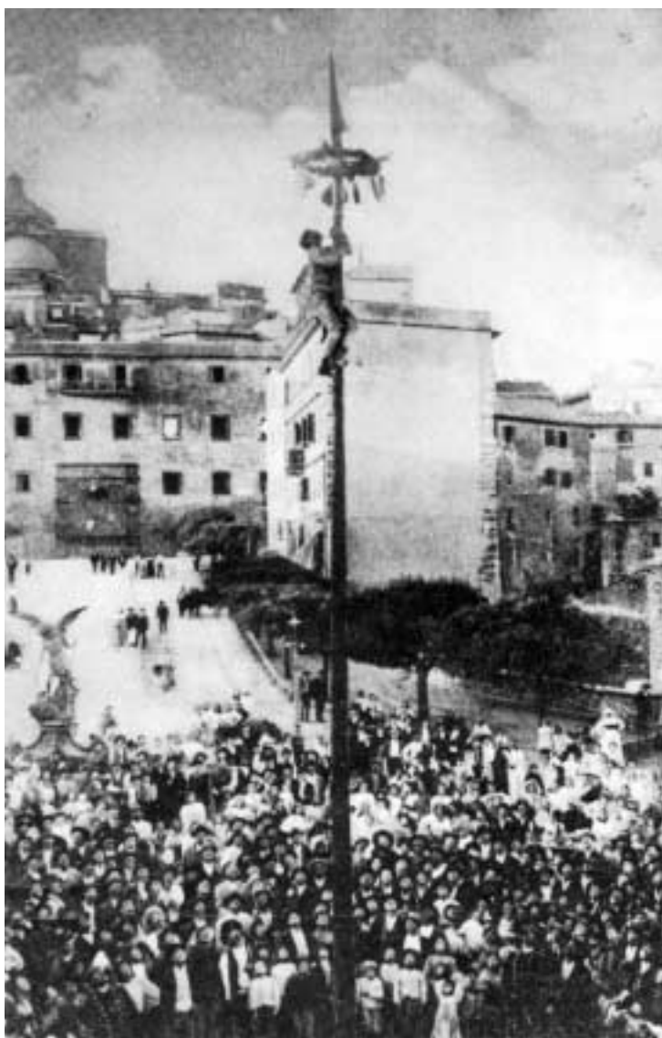
L'albero della cuccagna.