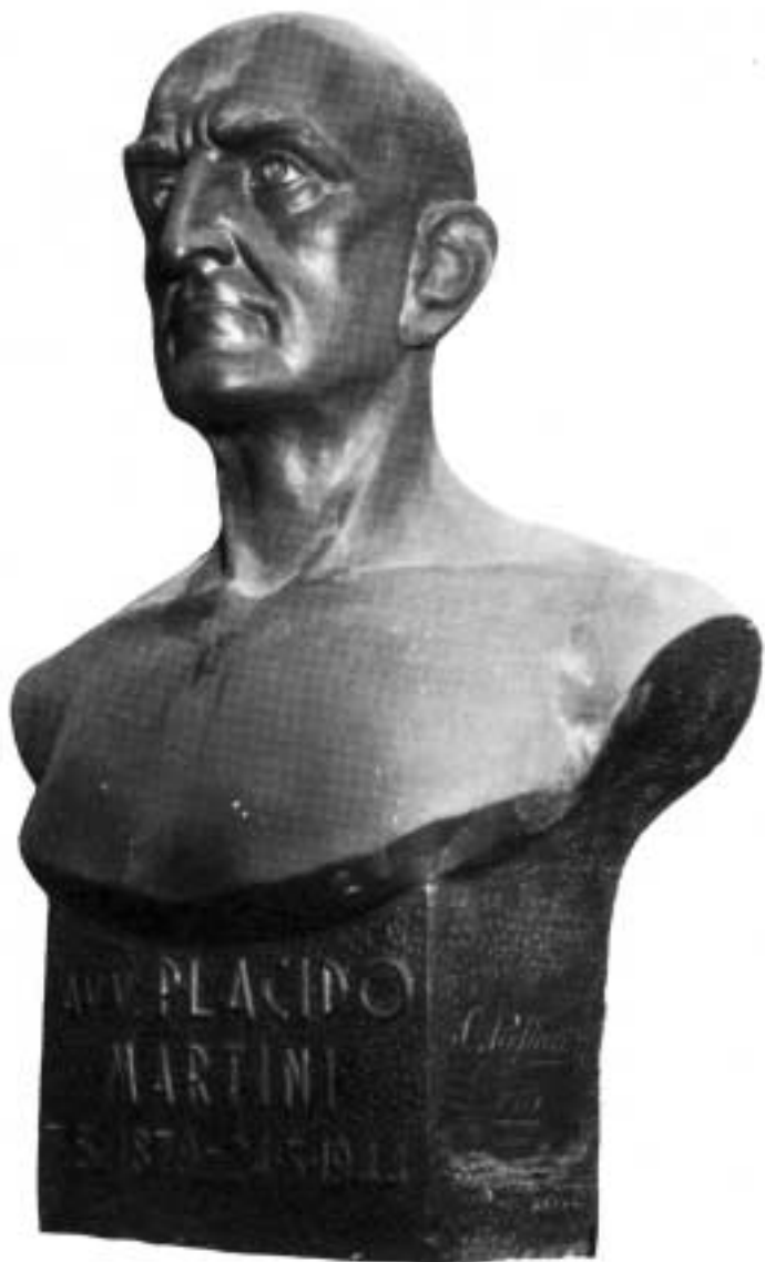
Busto di Placido Martini, di Curzio Pagliari.