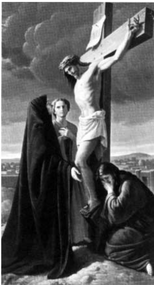
«Donna, ecco tuo figlio» (opera di A. Messori).