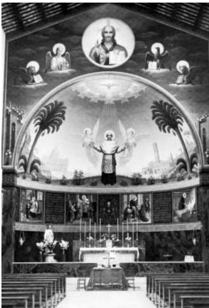
Abside della Chiesa di S. Giov. Battista De Rossi in Roma. (Opera di A. Missori)