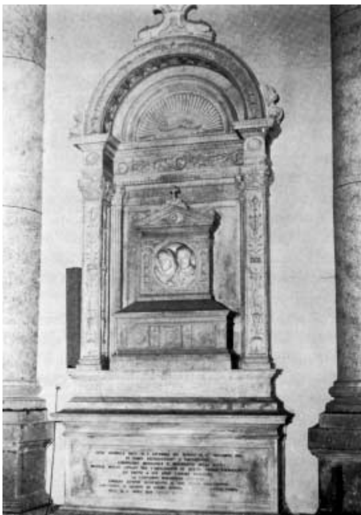
Monumento ai coniugi Nardella nel Duomo di Monte Compatri.