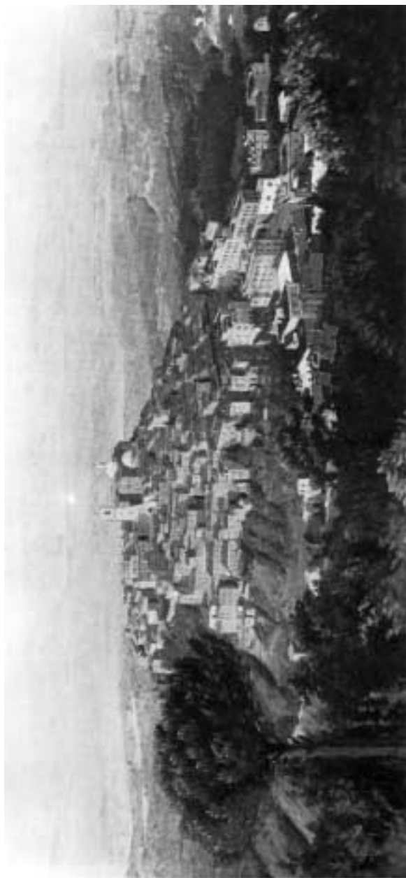
Panorama di Monte Compatri, (opera di A. Missori).