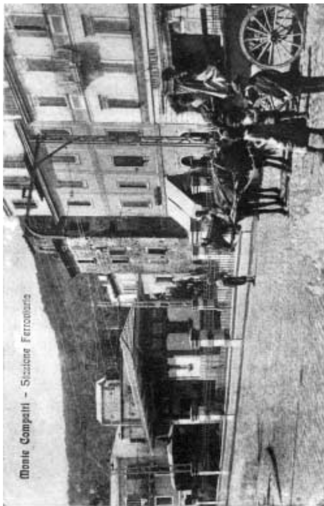
La vecchia stazione delle Ferrovie.